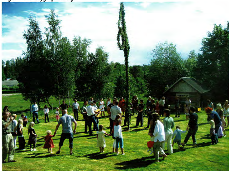
Midsommarafton på Tomta